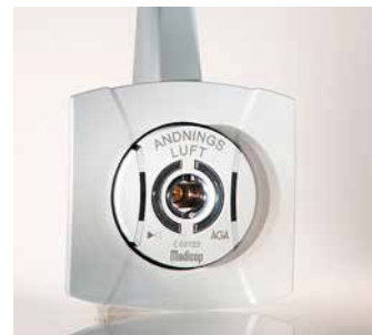
SmartLet süvistatud paigalduseks