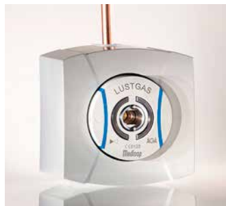
SmartLet pinnapealseks paigalduseks